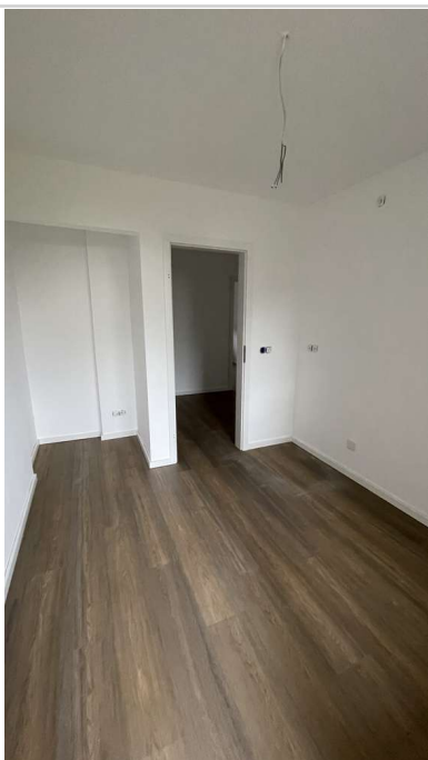
Küche mit Abstellraum

Zimmer: 3,00 Wohnfläche ca.: 69,00 m 2 Kaltmiete: 845,00 EUR (zzgl. Nebenkosten) Gesamtmieta: 1.165,00 EUR